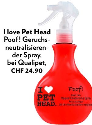
I love Pet Head Poof! Geruchsneutralisierender Spray, bei Qualipet, CHF 24.90