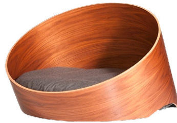
Miacara Hundekorb Covo, aus Nussbaumholz, www.bellmidable.ch , CHF 599.-