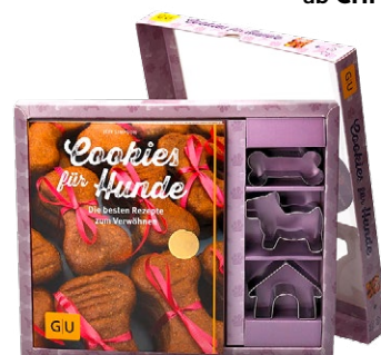
GU «Cookies für Hunde» Rezeptbuch mit Ausstechformen, www.books.ch , CHF 21.90