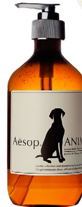
Aesop Haut- und Fellreiniger Animal, 500 ml, CHF 39.-