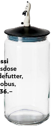
Alessi Vorratsdose für Hundefutter, bei Globus, CHF 36.-