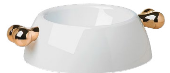
Bellomania Spülmaschinenfester Fressnapf Bones, www.lovelydogs.ch , ab CHF 20.-