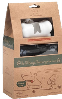
Pfister Hundesäckli Dog-Toiletty mit Dispenser in Knochenform, CHF 29.95