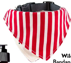
Wildebeest Bandana-Halsband, www.petsstore.ch , CHF 29.90