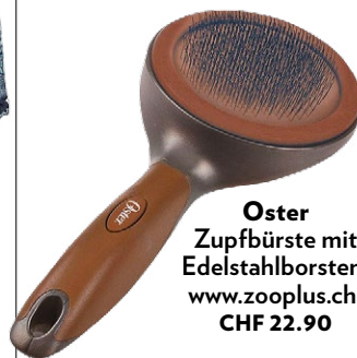
Oster Zupfbürste mit Edelstahlborsten, www.zooplus.ch , CHF 22.90